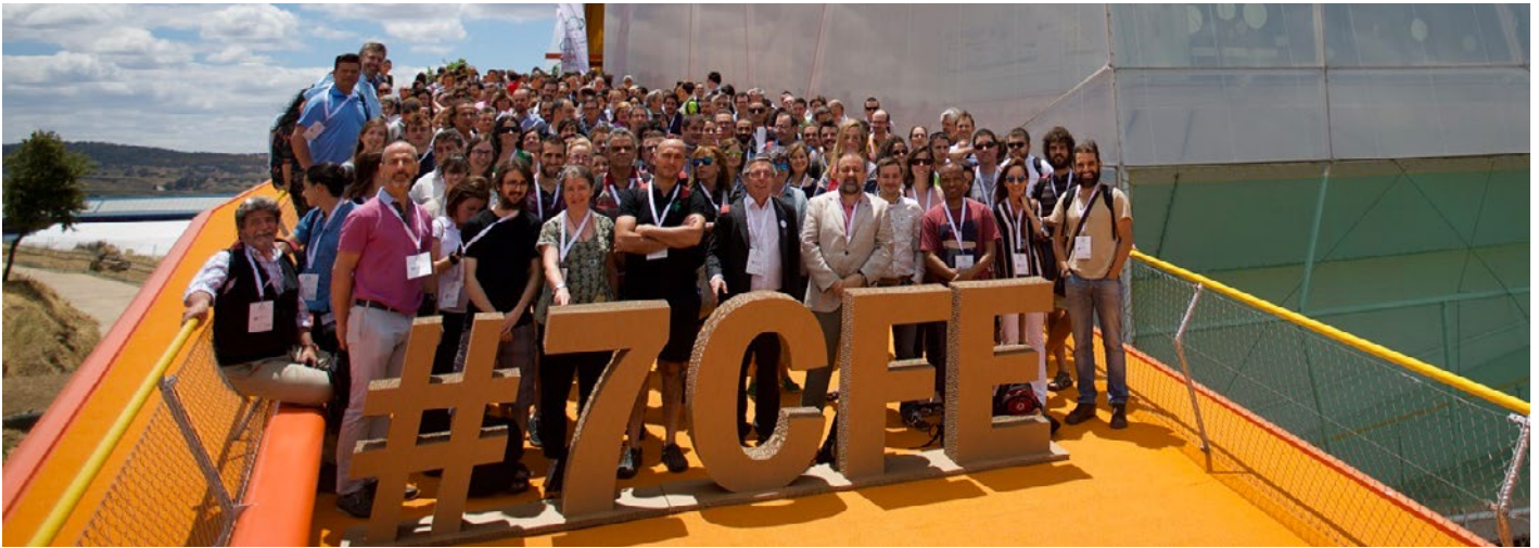
Foto de familia de los asistentes en el 7º Congreso Forestal Español en Palencia.

500 números de El Leño, todo un logro de la Delegación de Alumnos desde 1994, así que enhorabuena a todos los que lo han hecho posible. Se trata de un ejemplo de constancia y un compromiso logrado gracias al esfuerzo de múltiples equipos e integrantes de la Delegación a lo largo de todos estos años; algo parecido y casi en paralelo a otra iniciativa de la que vamos a hablar en esta breve colaboración: el Congreso Forestal Español (CFE).