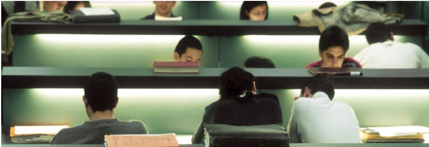
Imagen de archivo.

Qué difícil nos parece esto a veces, ¿no? Con examen el lunes, las prácticas por la tarde después de toda la mañana en clase, la hora extra el viernes antes de comer en esas "Actividades complementarias" del horario...Y tantas más que os vais a encontrar chicos de primero...Además, tendremos que estudiar en algún momento, ¿cuándo vemos la luz del sol entonces? No. Esto no va así. Si no veis la luz del sol es que algo hacéis mal. Esto va especialmente dedicado a los de primeros años de carrera y os hablo desde mi experiencia de dos años en la Escuela. Vivid. No me refiero a levantarse, ir a clase, comer, ver un rato a tus amigos en el cambio de clase, estudiar, "guasapear", dormir, y todo mientras creces y respiras. Creo que hay que vivir la vida universitaria, porque por algo la llaman vida. Nos da vida. No son cuatro años de estudiar para aprobar. No es "jugársela a todo" en un examen que empiezas a estudiar dos días antes. La universidad está para aprender y, de ello, conseguir una vida profesional que nos apasione. Quien no esté de acuerdo puede dejar de leer. Pero yo quiero que viváis en la universidad, porque eso nos hace cada día un poco mejor. Que toméis las clases con ganas, me da igual si no se os da bien; con más razón. Que le deis una oportunidad al profesor que os ha caído mal el primer día. O dos...O tres...Porque vais a aprender a